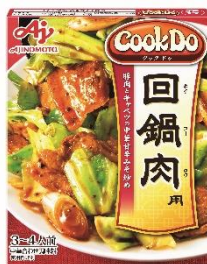
「Cook Do®」 <回鍋肉用>