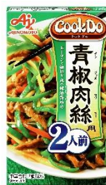
「Cook Do®」 <青椒肉絲用>2人前